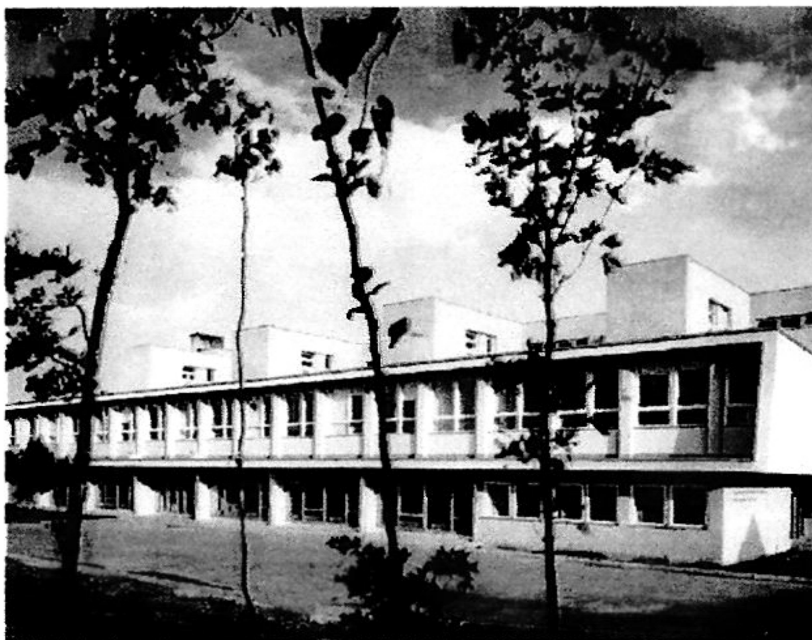
Budova základnej školy, Bratislava-Prievoz