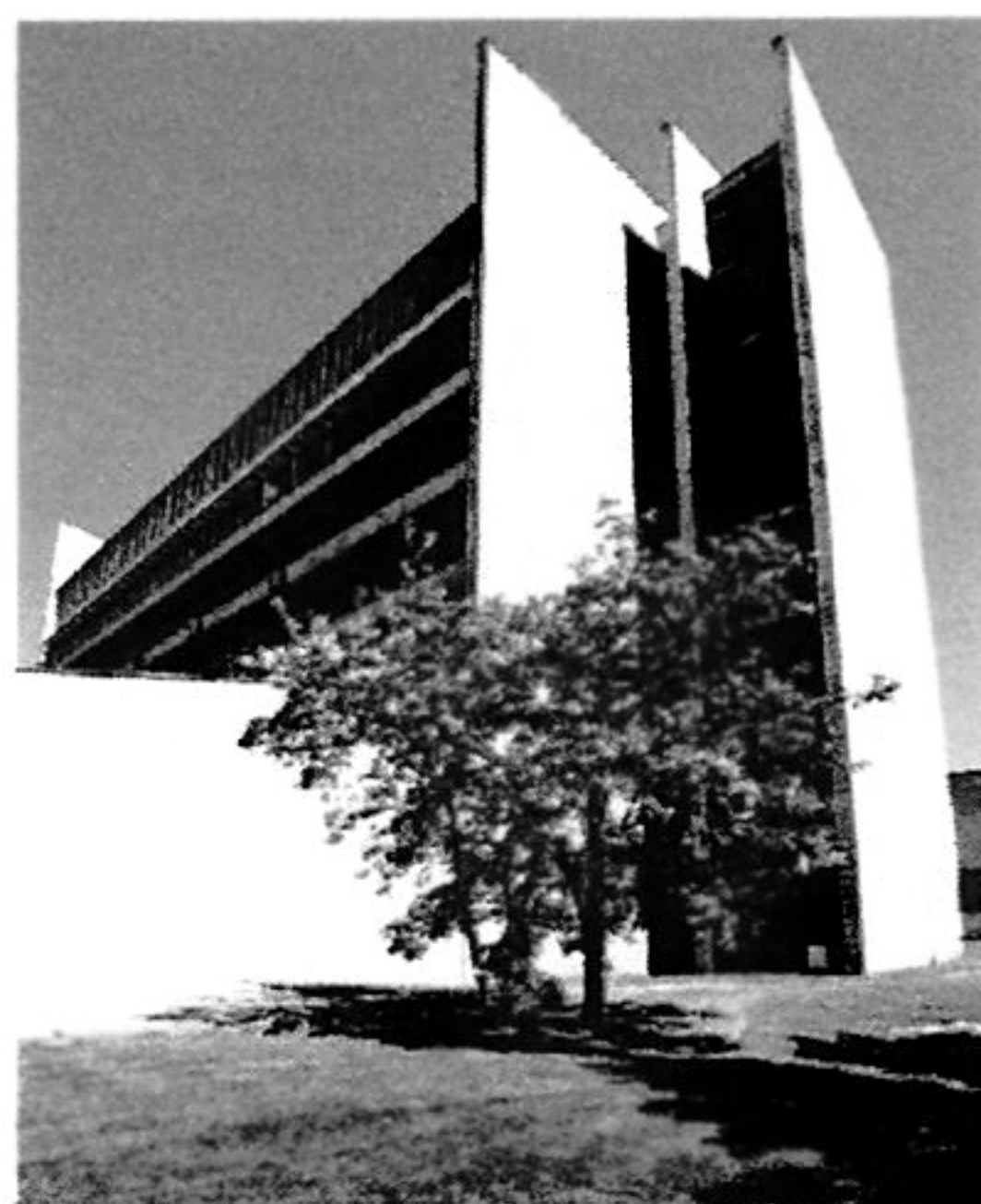
Virologický ústav SAV, Bratislava-Patrónka