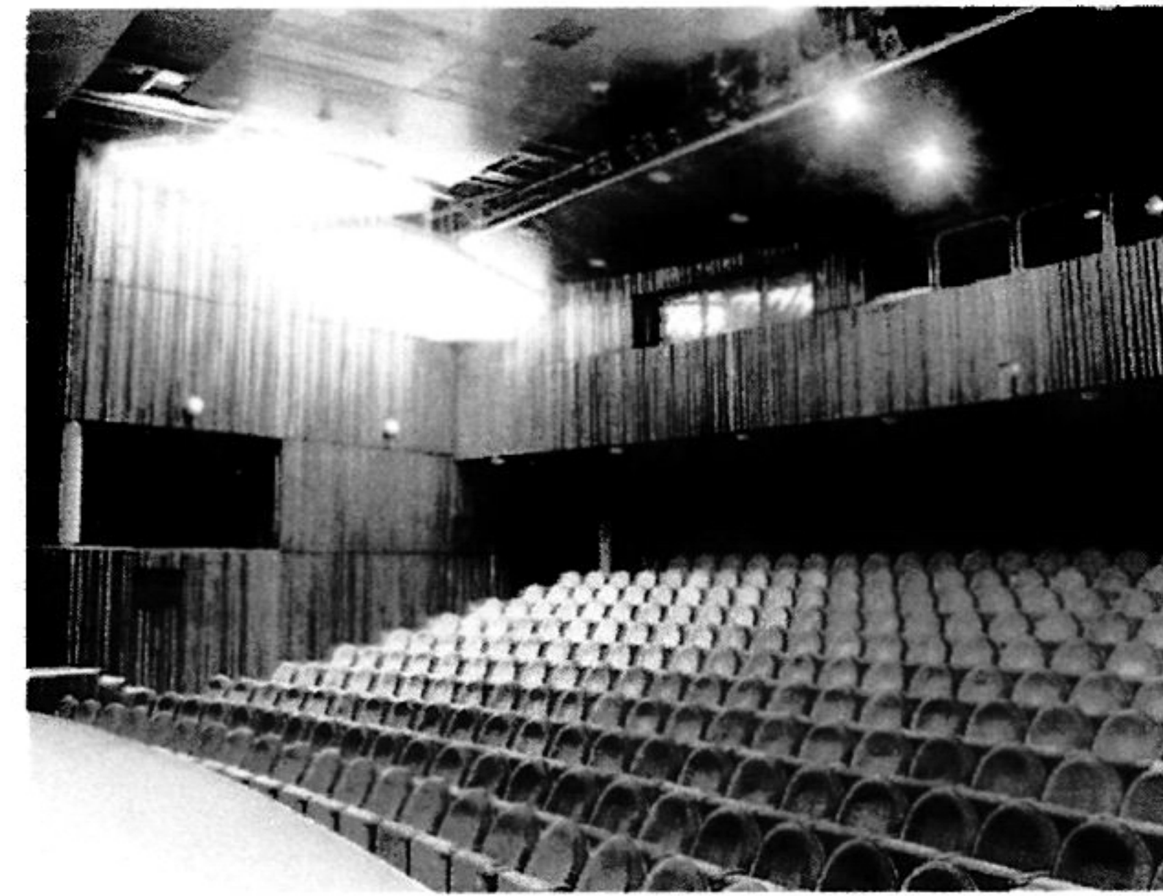
Divadlo JGT vo Zvolene – interiér