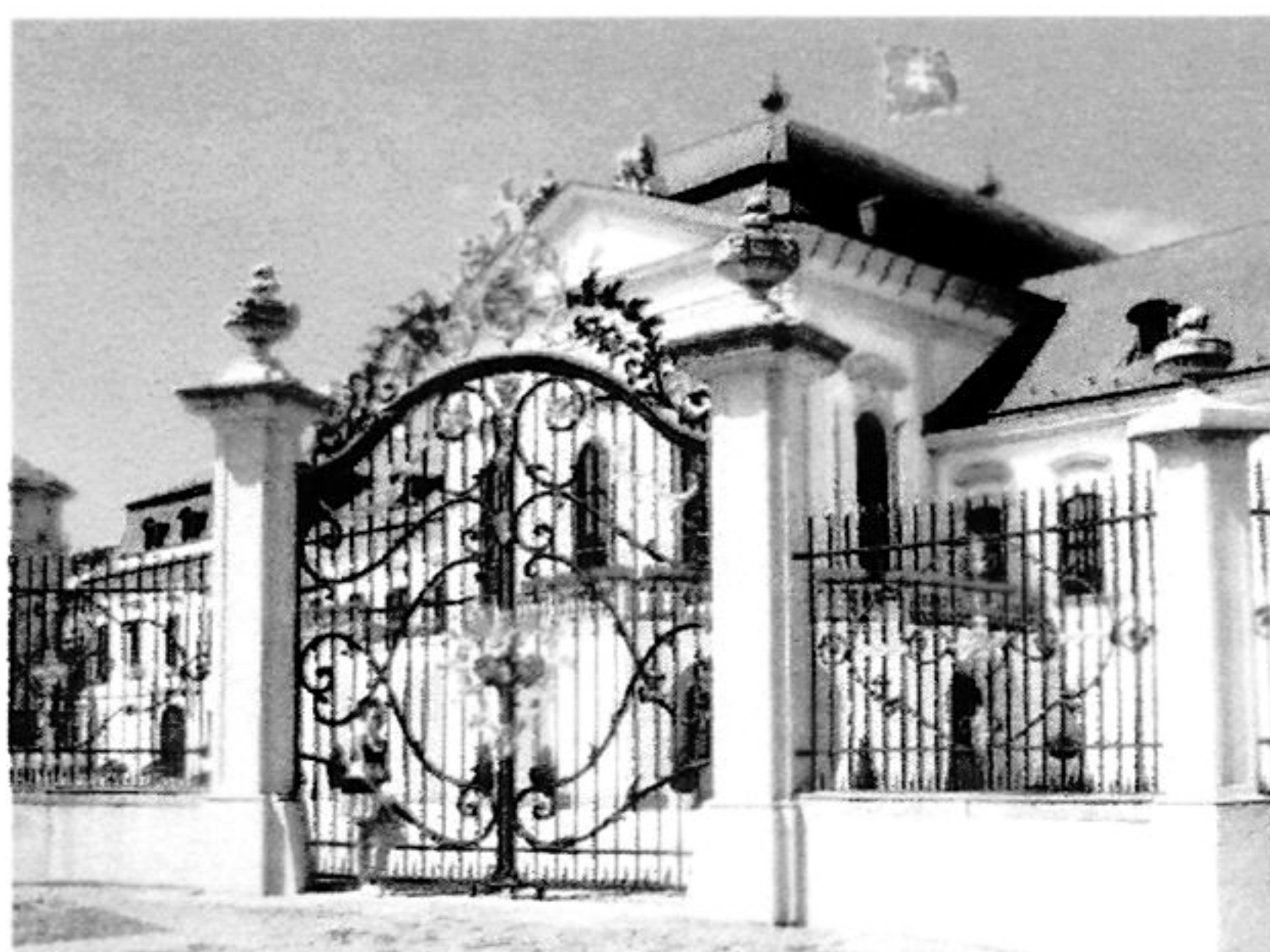
Grassalkovichov – Prezidentský palác, Bratislava